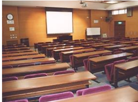
会議場 (佐鳴会館会議室)